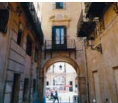
Plaza del Ayuntamiento

ser los palacios repartidos por la ciudad. Al margen del casco urbano, el visitante puede realizar excursiones a poblaciones turísticas y parajes de la Costa Blanca.