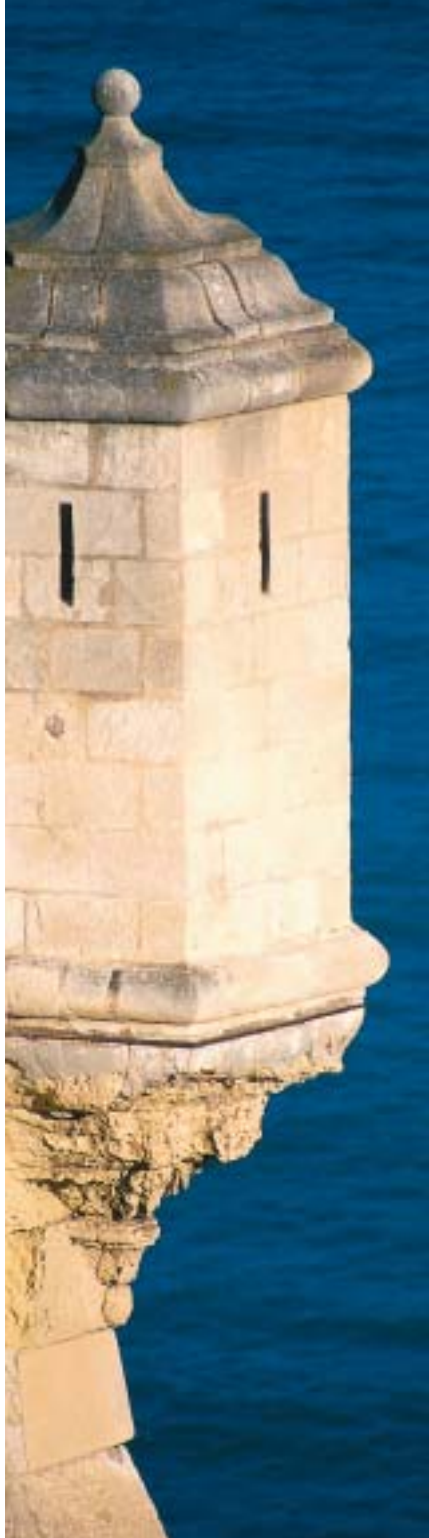
Castillo Santa Bárbara

automóvil por la parte de atrás tomando la prolongación de la avenida de Alfonso X el Sabio.