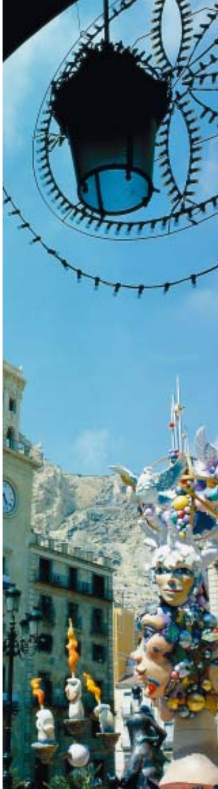
Hoguera del Ayuntamiento

tan a comer, cenar y charlar con los amigos. Como testigos mudos se colocan por toda la ciudad más de doscientas hogueras realizadas en cartón piedra que recogen acontecimientos de la ciudad y el mundo, impregnados de grandes dosis de ironía.