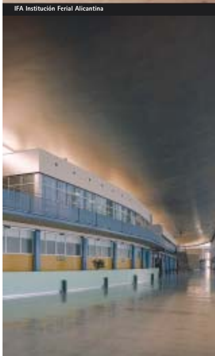
Hall de recepción de IFA