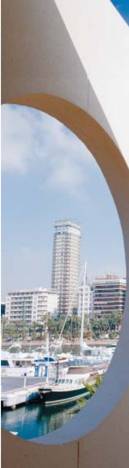
Detalle del puerto