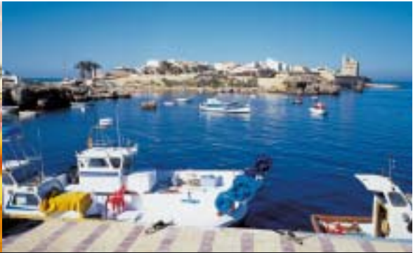
Puerto de Tabarca

La isla -a unos 45 minutos en barco desde Alicante- tiene una longitud de 1.800 metros y una anchura de 450 metros. Refugio en su día de los piratas berberiscos que asolaban el Mediterráneo, el rey Carlos III mandó fortificarla en 1760 para después repoblarla con 600 pescadores de Génova que estaban cautivos en la ciudad tunecina de Tabarka, un istmo cercano a Argelia.