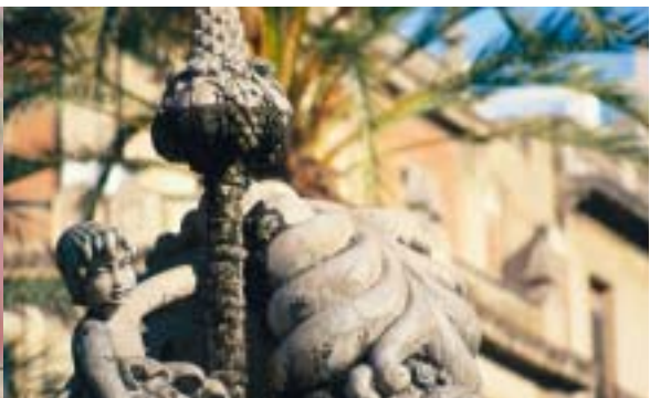
Detalle de la Plaza de los Luceros