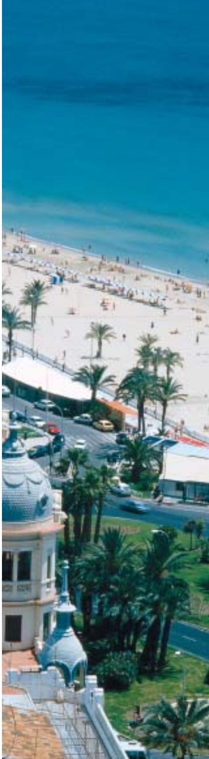
Playa del Postiguet

piratería industrial desde 1996, cuando comenzó a registrar marcas.