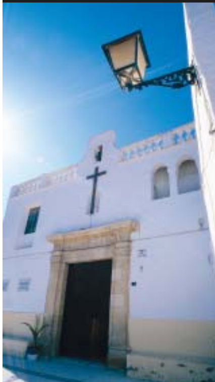
Ermita de Santa Cruz