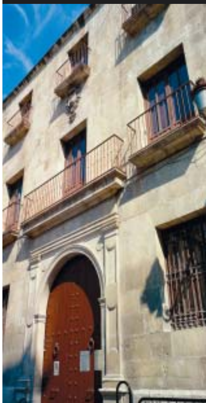
Casa de La Asegurada