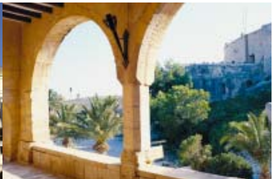
Castillo de Santa Bárbara

tral, con dos pares de columnas salomónicas y una puerta trasera más pequeña, recayente en la plaza de la Santísima Faz, que tiene magníficos labrados en piedra. En la segunda planta, la fachada está decorada con doce pequeños balcones con una trabajada herrería. Sobre la puerta principal, se ubica esculpido en mármol blanco el escudo de la ciudad.