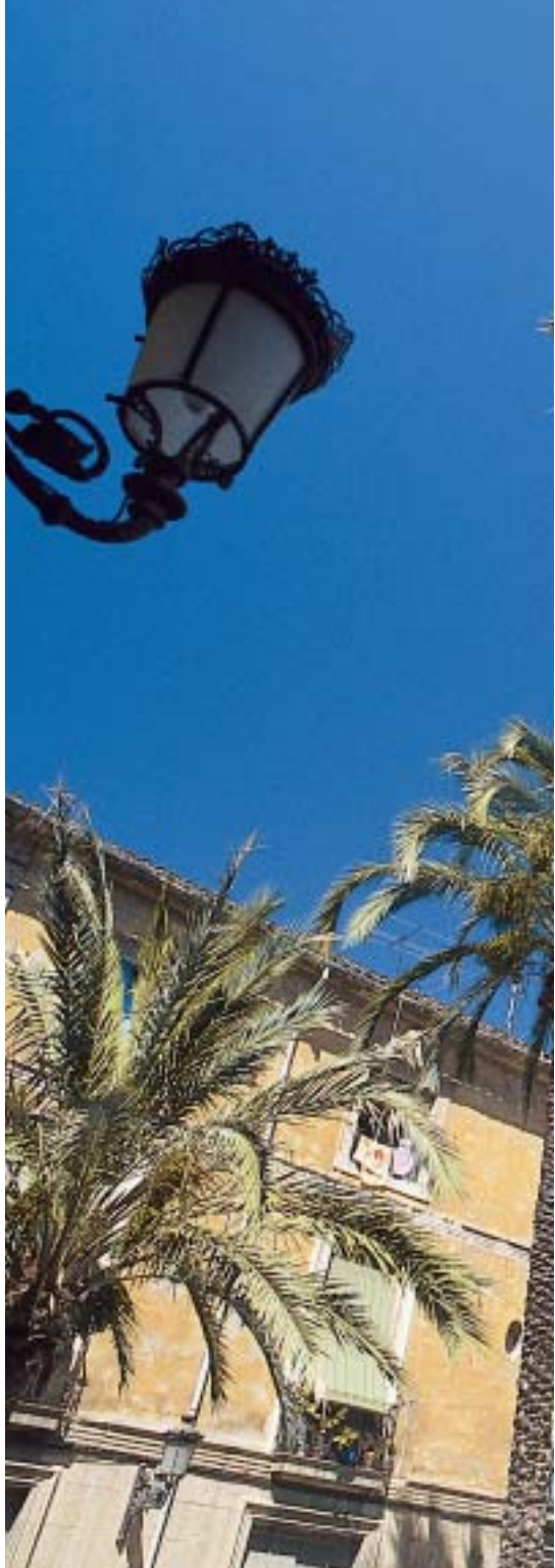
Plaza Santa Faz

Anises de Monforte del Cid, moscateles de Teulada o Xaló y el famoso “Fondillón”, un vino dulce que se embotella con reserva. Calzado en Elda, Villena y Elx, textil en Alcoy y alfombras en Crevillent. La provincia de Alicante es también la cuna del juguete español. Las principales fábricas están en Ibi y Onil. Si quiere artesanía puede encontrarla de Biar, Agost y Gata de Gorgos. Famoso es también el mueble de Almoradí.