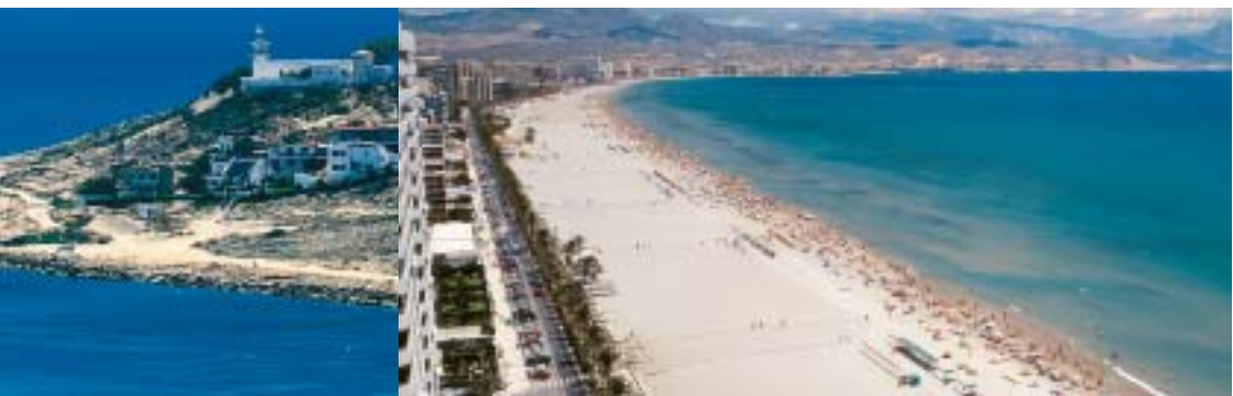
Playa de San Juan

Existe un campo de golf de 18 hoyos rodeado de viviendas que le dan vida durante todo el año. Su “casco urbano” cuenta con centros