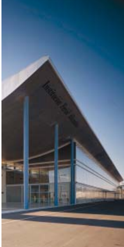
IFA Institución Ferial Alicante