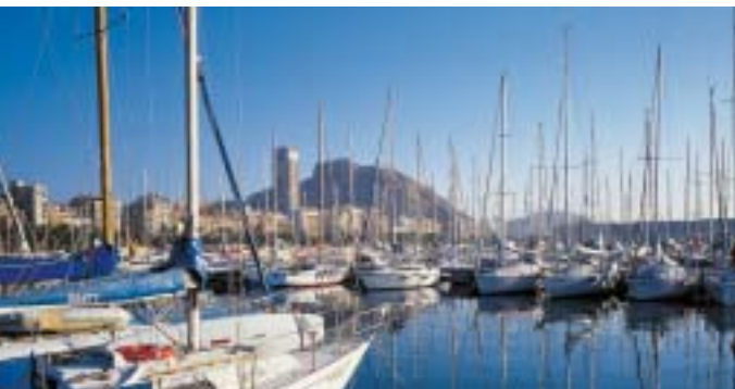
Real Club de Regatas de Alicante