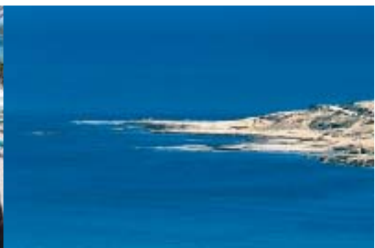
Cabo de las Huertas