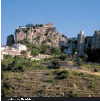
Castillo de Guadalest