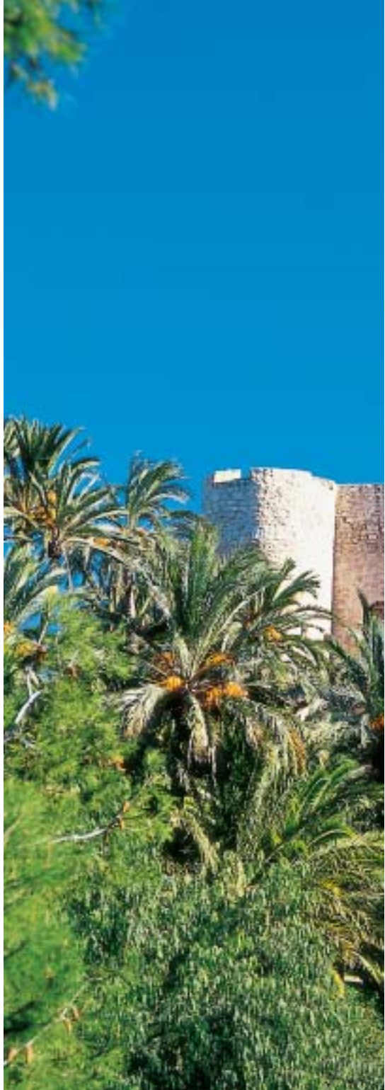
Palmeral de Elx

Rodeada por los parques naturales de la Sierra de Mariola y el Carrascar de la Font Roja, Alcoy se alza como una ciudad que ha superado su peculiar orografía, salpicada por barrancos. Conocida como la ciudad de los puentes, el municipio conserva huellas de la primera industrialización de las tierras valencianas, bellos ejemplos del Modernismo y destacan entre sus manifestaciones festivas las fiestas de Moros y Cristianos, en abril, declarada de interés turístico internacional, y la Cabalgata de los Reyes Magos, la más antigua de España.