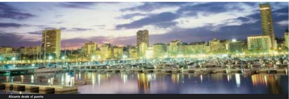
Alicante desde el puerto