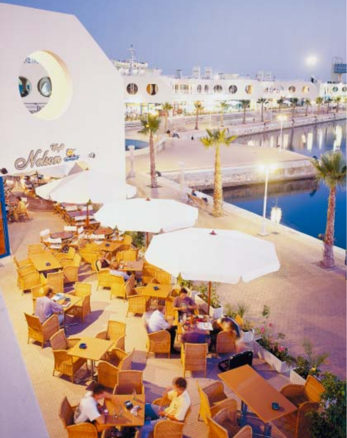
Zona de ocio del puerto de Alicante