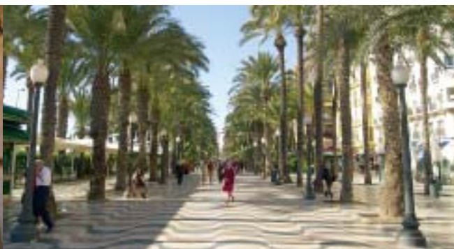
Explanada de España