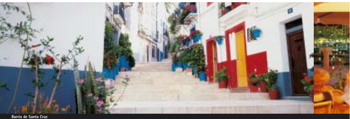
Barrio de Santa Cruz

Cita obligada por los visitantes es la zona de ocio del Puerto. Surgió por la transformación de muelles en desuso en un gran paseo