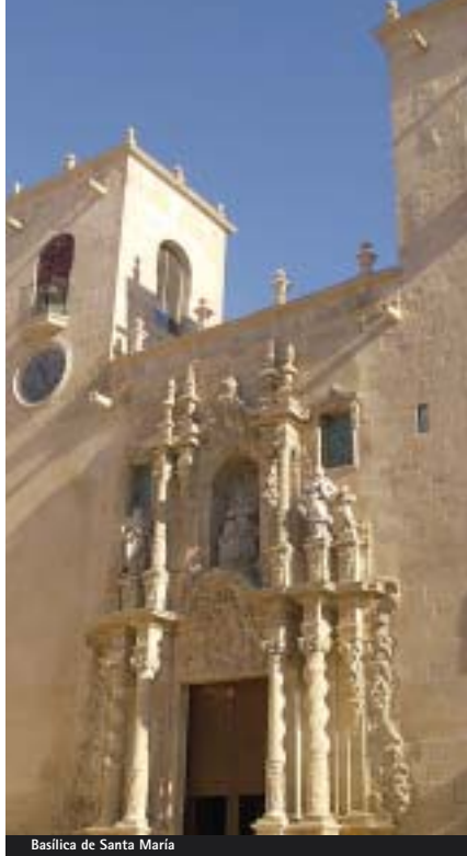
Basilica de Santa María