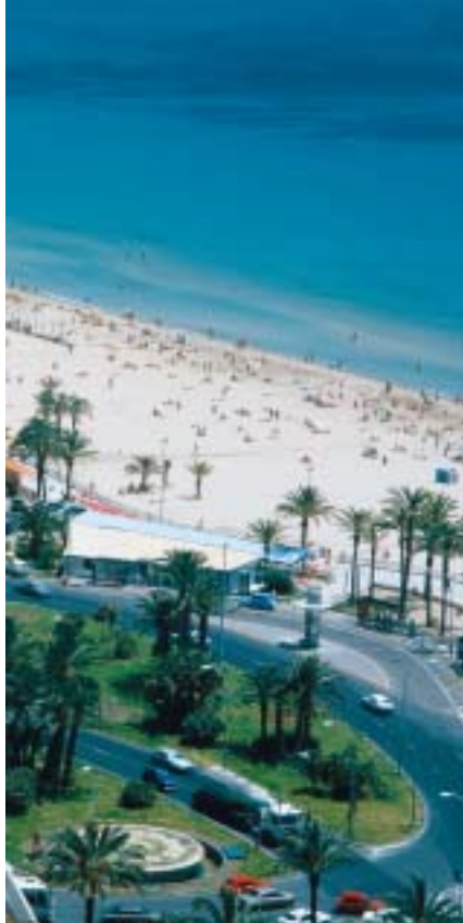
Playa del Postiguët

El 6 de diciembre es la festividad del Patrón de Alicante. Fiesta eminentemente religiosa con la procesión del santo acompañado por gigantes y cabezudos. Por la tarde tiene lugar el desfile general de Moros y Cristianos que arranca en la avenida de Alfonso X El Sabio.