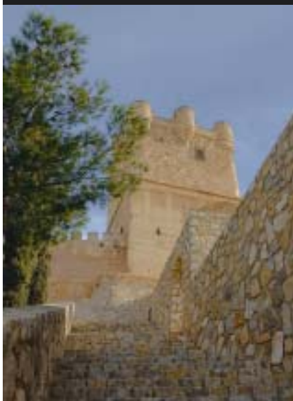
Castillo de Villena