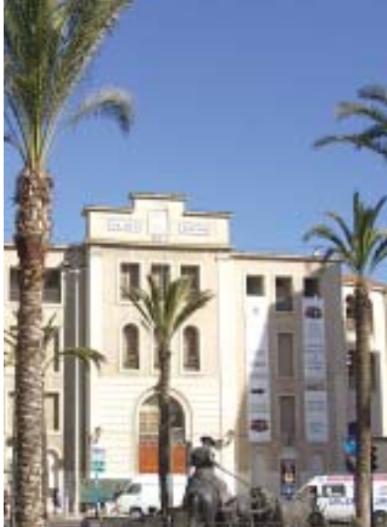
Plaza de Toros

A espaldas del edificio del Ayuntamiento se encuentra la plaza de la Santísima Faz . De su diseño inicial apenas queda su geometría. Igualmente tradicional es la plaza de Calvo Sotelo , en pleno centro comercial de la ciudad. Urbanizada en el siglo XVI, se ajardinó en 1874 y diez años después se le colocó el busto del gobernador Barrejón, héroe como lo fue Quijano. En el inicio de la Avenida de Maisonnave se conserva el monumento a Eleuterio Maisonnave, realizado por Vicente Bañuls en 1895 y erigido en memoria del insigne político alicantino, que hoy da nombre a la avenida más comercial de la ciudad y la sexta de España. Maisonnave, fue alcalde de la ciudad, fundador de la primera caja