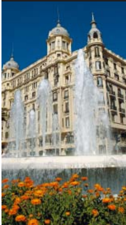
Plaza Puerta del Mar