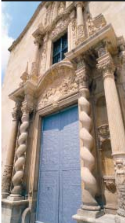
Monasterio de la Santa Faz

Ctra. Alicante–Valencia, km. 8 Tel. 965 26 49 12