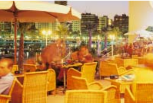
Terraza del Puerto de Alicante

siglo XVIII. Destacan la Casa del Gobernador, la iglesia de San Pedro y San Pablo -hoy en proceso de restauración-, así como la Torre de San José, fuera del casco urbano.