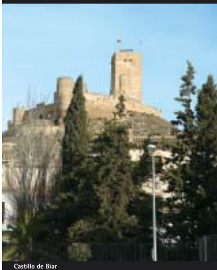
Castillo de Biar